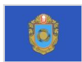
Черкаське земляцтво "Шевченків край" у м.Києві