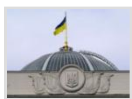
Народні депутати України від Черкащини