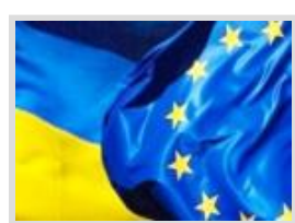
Місцевий розвиток, орієнтований на громаду