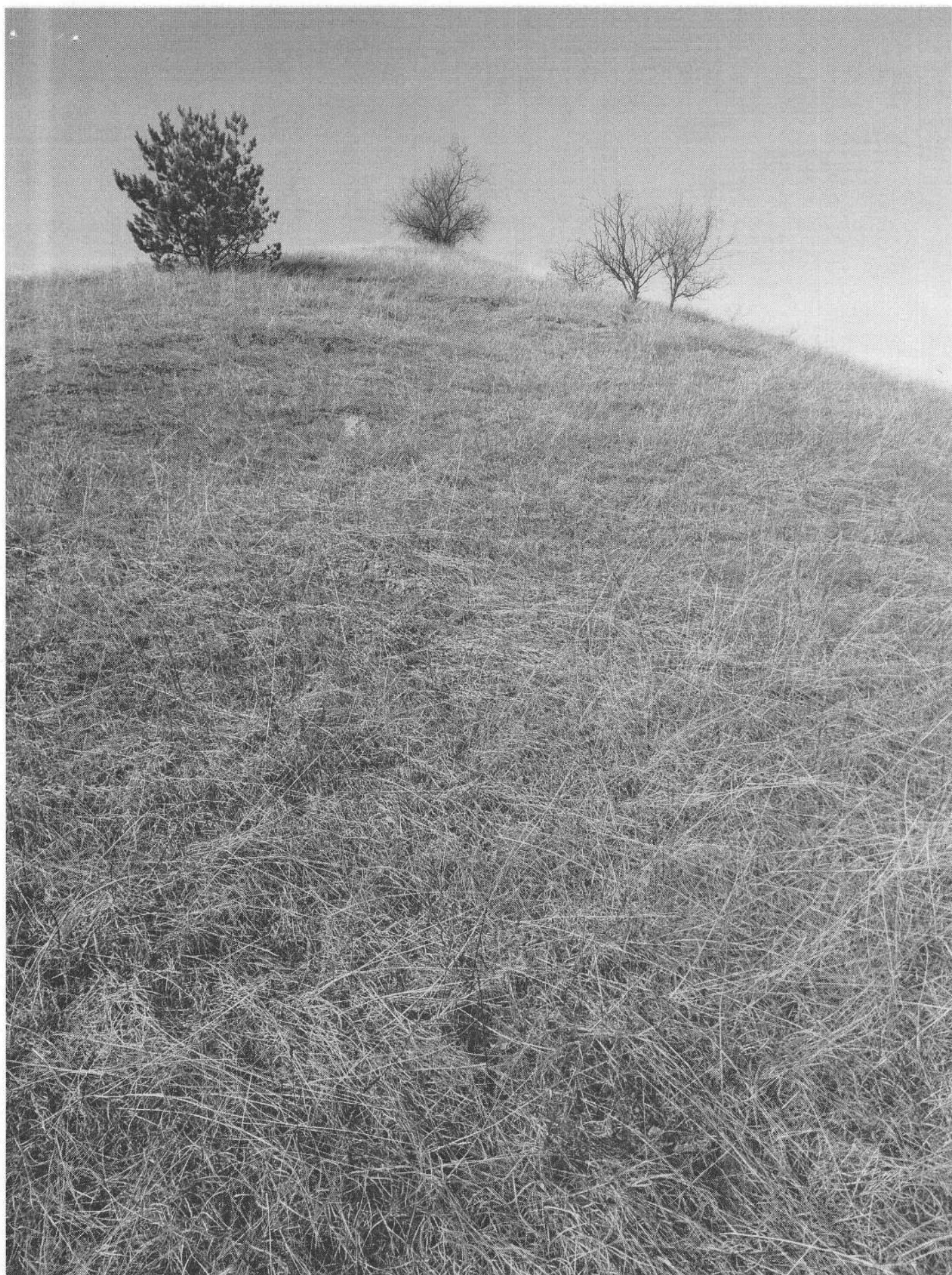
Гора Брандушок лѣс, гора прироста